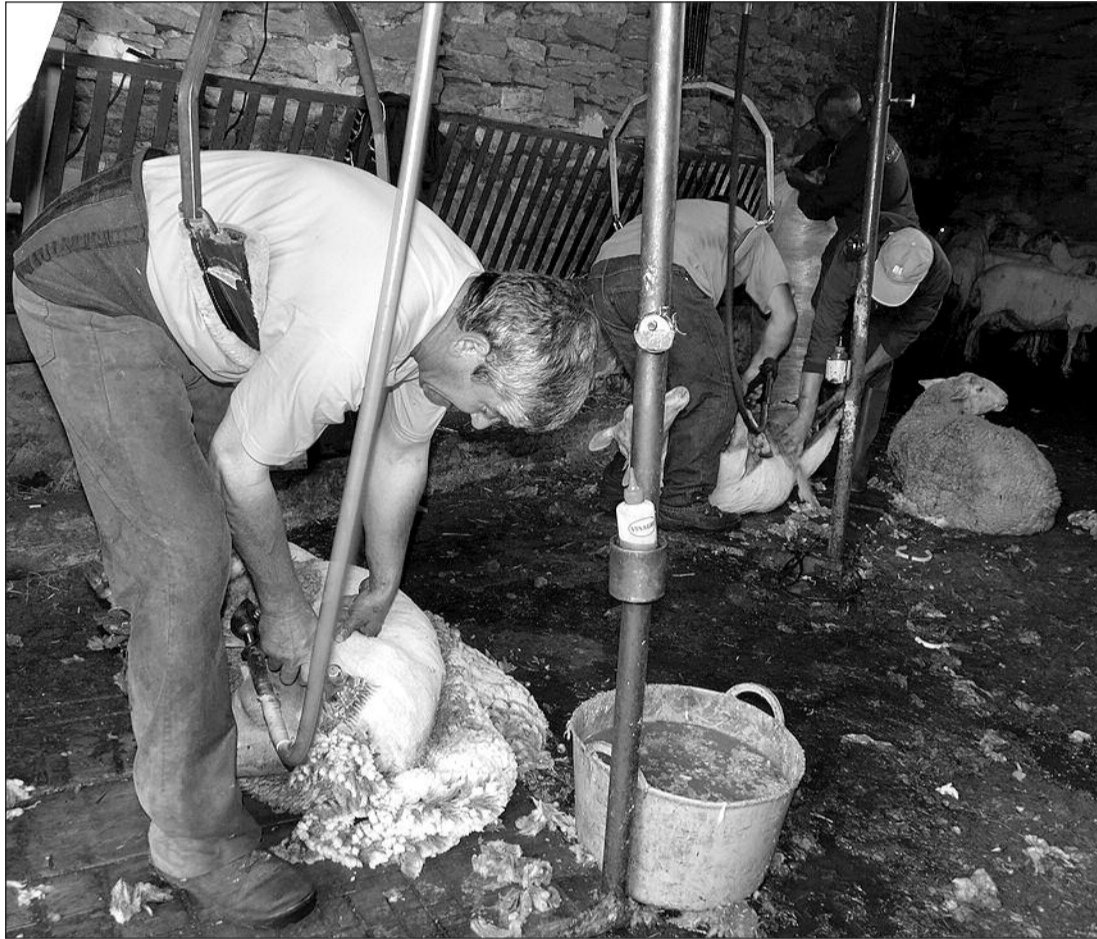
El trabajo del esquila será uno de los que se podrá conocer en la Muestra de Artesanía de Linares

La actividad ha sido promovida por el Ayuntamiento y la intención es darle continuidad. López recordó que la primera muestra de artesanía se realizó en Linares de Mora ya en 2002, aunque matizó que en esta ocasión se han añadido muchos más oficios.