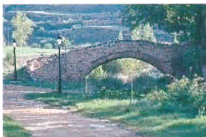
Puente del Loreto